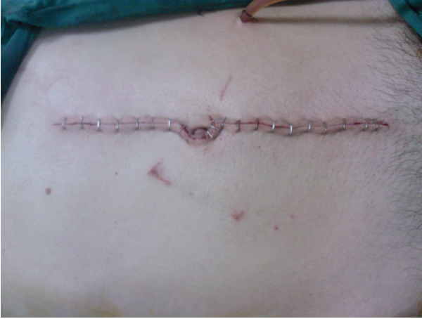
Resim 1. Göbek çevresinde travmaya bağlı laserasyon

(Resim 2). Diğer batin içi organlarda patoloji saptanmadı. Batının temiz olması nedeniyle defekt primer onarıldı. Bir adet dren konularak ameliyata son verildi. Takiplerinde herhangi bir sorun saptanmayan hasta 7. günde şifa ile taburcu edildi.